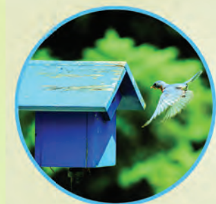
Maintien à domicile